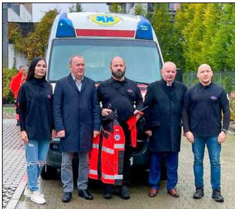
Zarząd Fundacji Omega-Hope oraz władze PAM

Masz poczucie humoru? Śpiewasz, uprawiasz ciekawy sport? Pomagasz innym - jesteś wolontariuszem? Piszesz wiersze, rysujesz, może masz hobby, którego nie znamy? Podziel się z nami swoją pasją albo dołącz do współpracowników Pulsu Uczelni!