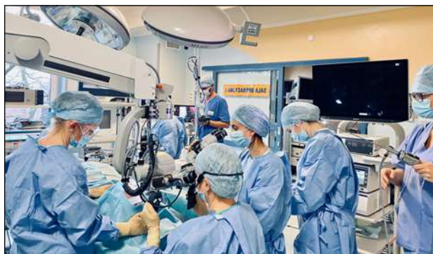
Operacja transmitowana z Poznania podczas VII sesji, 2022 rok