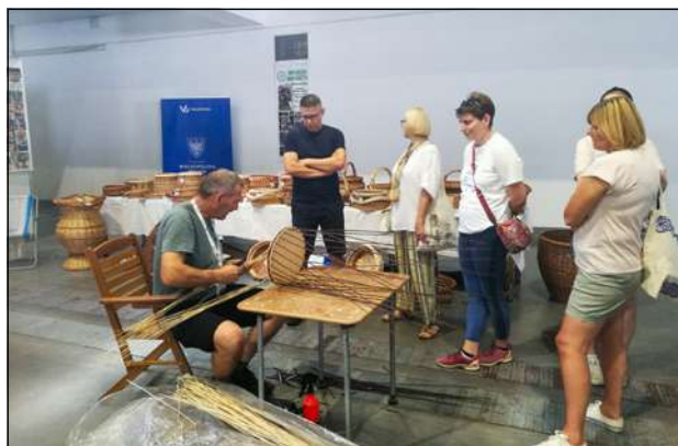
Pokaz wyplatania podczas V Festiwalu Wikliny i Plecionkarstwa, 2023.