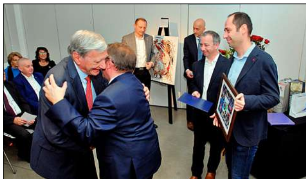
Jubilatowi życzenia składają przedstawiciele PCSS.