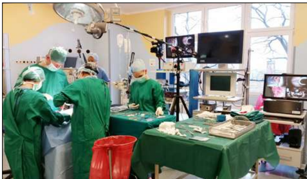
Jedna z operacji transmitowanych podczas I sesji, 2015 rok

Europejskie Sesje Chirurgii Laryngologicznej zyskały uznanie wśród widzów z ponad 100 krajów, stając się znaczącym wydarzeniem w kalendarzu medycznym. Bieżącą edycję śledziły ☛