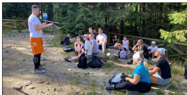
Wykład w plenerze