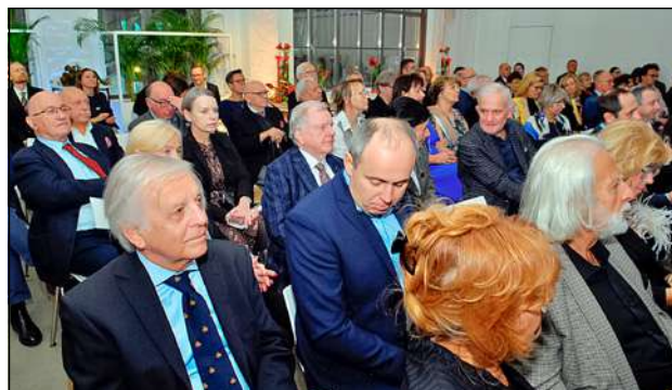
Goście przybyli na jubileuszową uroczystość.