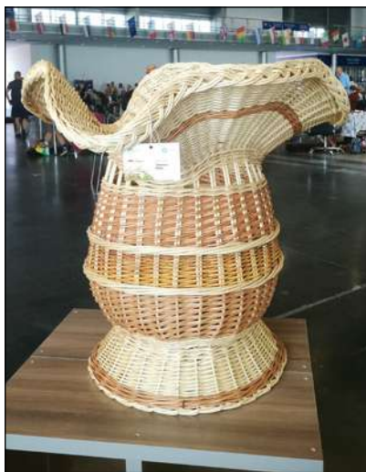
Kosz autorstwa T. Pięty przestany na konkurs w czasie V Festiwalu Wikliny i Plecionkarstwa, 2023.

Moją przygodę na konkursach zacząłem od skoku na głęboką wodę, a mianowicie od konkursu na II Światowym