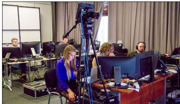
Zaplecze VII sesji w PCSS, 2022 rok