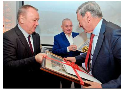
JM Rektor i Założyciel-Kanclerz PAM przekazują Profesorowi życzenia i upominki od naszej Uczelni

Już następnego dnia rozpoczęły się zajęcia na tym kierunku. Odbył się pierwszy wykład z fizjologii z elementami