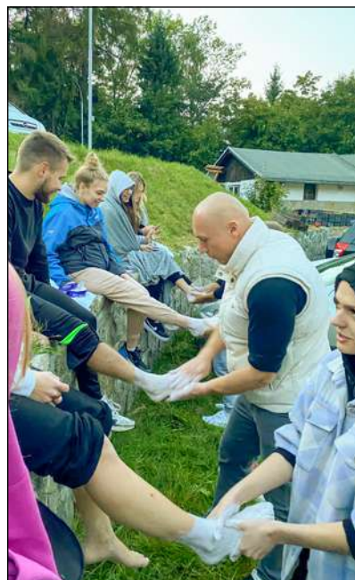
Ćwiczenia praktyczne w plenerze