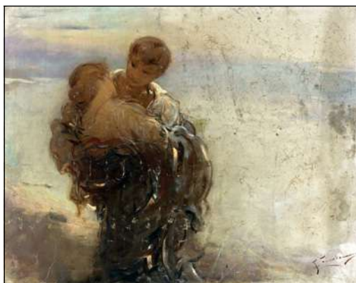
F. Żmurko, W upojeniu , Muzeum Narodowe w Warszawie.

Przełamanie tabu seksualnego w naukach seksuologicznych ma więc istotne znaczenie dla rozwoju tej dziedziny, a także dla poprawy zdrowia seksualnego i dobrostanu społecznego.