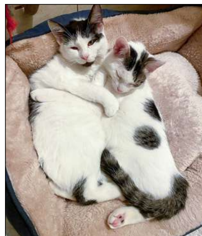
Podopieczni Fundacji Psitulisko.