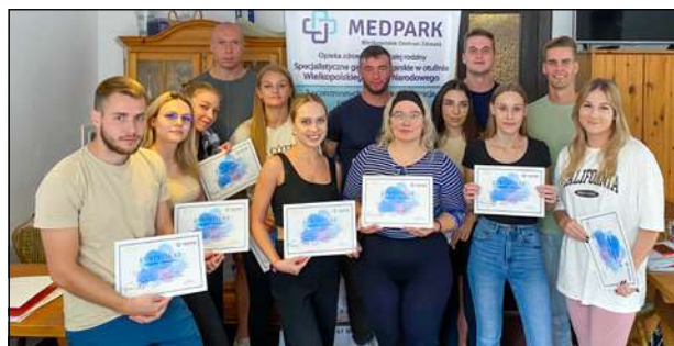
Uczestnicy szkolenia prezentują otrzymane zaświadczenia