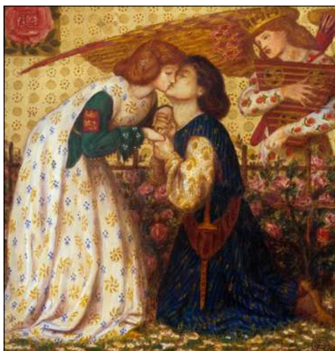
Dante Gabriel Rossetti, Roman de la Rose, 1864.

Wpływ na rozwój osobisty: od najmłodszych lat, tabu seksualne wpływa na sposób, w jaki ludzie poznają i ro-