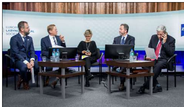
Moderatorzy VII sesji, 2022 rok