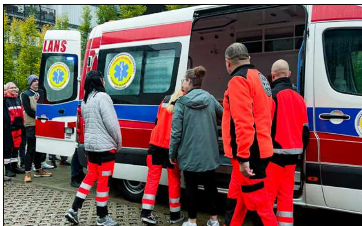
Prezentacja wyposażenia ambulansu